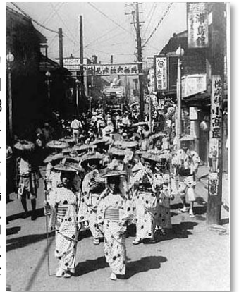
昭和28年 夏の鶴見神社祭り